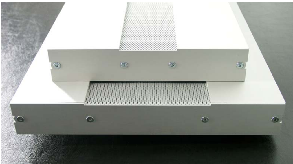
Größenvergleich D-Flat / D-Flat 190